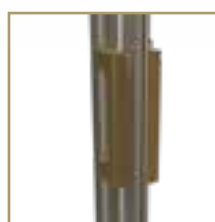
MANIGLIE PRIME INTERNA/ESTERNA

Bottone antivento ai lati, impediscono al tessuto di fuoriuscire dalle guide in caso di vento o di spinte accidentali.