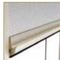
CHIUSURA A TORSIONE