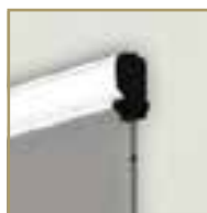
RETE ELETTROSALDATA AI LATI

Bottone antivento ai lati, impediscono al tessuto di fuoriuscire dalle guide in caso di vento o di spinte accidentali.