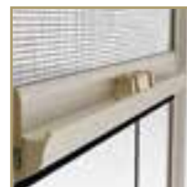
CHIUSURA A CRICCHETTO