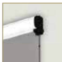
RETE ELETTROSALDATA AI LATI