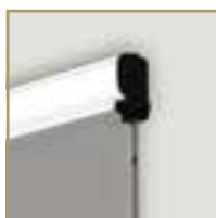
RETE ELETTROSALDATA AI LATI